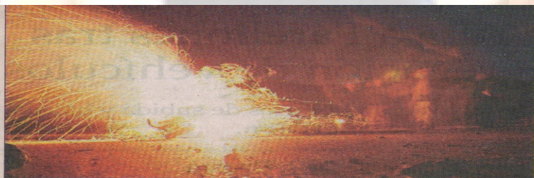
BARRICADAS. — Con fogatas bloquearon la Carretera del Cobre y resultaron dañados 27 vehículos de transporte.