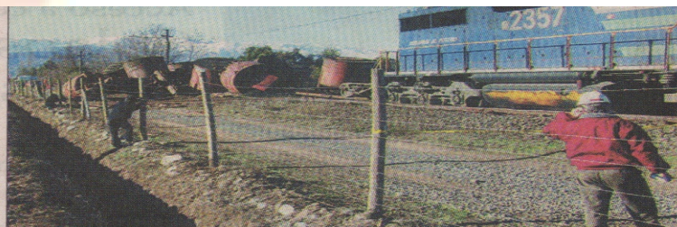
SABOTAJE. — Desconocidos provocaron el volcamiento de un convoy cargado con concentrado de cobre, que se dirigía a la refinera de Ventanas.