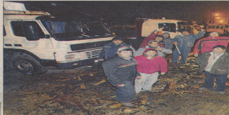
MOVILIZACIONES. — Un grupo de temporeros (izquierda) se tomaron ilegalmente las instalaciones. Fueron desalojados por Carabineros. Gremio de dueños de camiones (derecha) mantiene obstaculizado el paso en la ruta San Javier-Constitución.

Luego de casos de Celco y Codelco persisten conflictos laborales: