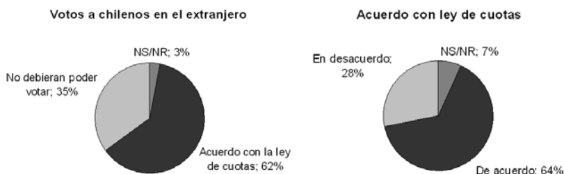
Figura 3: Demandas por cambios en voto a chilenos en el extranjero y ley de cuotas

en el statu quo : un 62% de los entrevistados cree que los chilenos que viven en el extranjero debieran poder votar en las elecciones presidenciales y un 64% está de acuerdo con una ley de cuotas para cargos de elección popular.